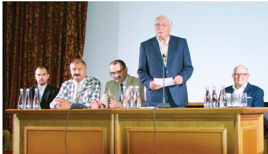
Відкриття конференції. 03.09.2018